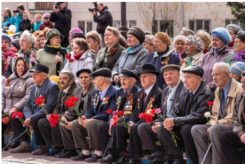
Ветераны Великой Отечественной войны, узники концлагеря, краснотурьинцы, пережившие блокаду Ленинграда.