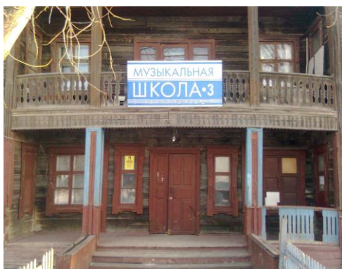
Православный приход во имя святителя Николая Чудотворца - временно находится в здании музыкальной школы.