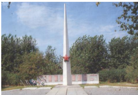
Обелиск в честь жителей поселка погибших в ВОВ