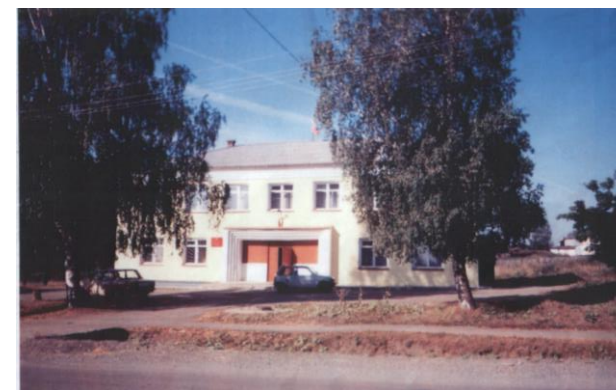
Администрация п. Рудничный