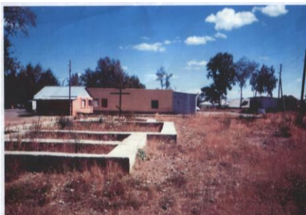
Закладка фундамента под храм во имя святителя Николая Чудотворца