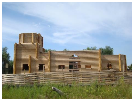
Строительство храма во имя святителя Николая Чудотворца