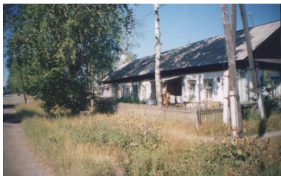
Один из первых барakov по ул.Октябрьской