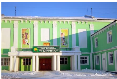
В ДК «Горняк» во время ВОВ находился госпиталь №3468 С 17.10.41. – 15.03.42г.г. на 200 коек, профиль общехирургический.