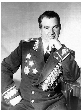
Маршал Советского Союза дважды Герой Советского Союза Василий Иванович Чуйков

В апреле 1943 года 62-я армия за мужество и героизм при обороне Сталинграда получила почётное наименование 8-й гвардейской. Сам Василий Чуйков был награждён орденом Суворова I степени.