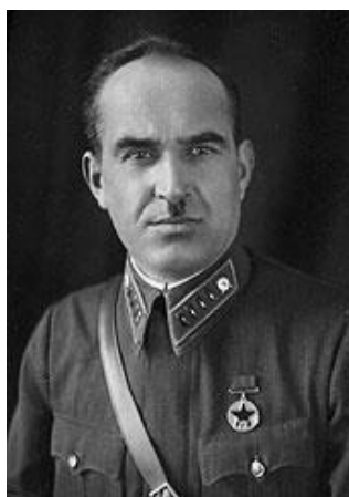
Советский генерал Иван Ильич Людников

С каждым днём всё надёжнее и неприступнее для противника становилась оборона города. Вот строки из письма убитого гитлеровского офицера, добытого нашими разведчиками: «Нам надо дойти до Волги. Мы её видим – до неё меньше километра. Нас постоянно поддерживает авиация и артиллерия. Мы сражаемся как одержимые, а к реке пробиться не можем».