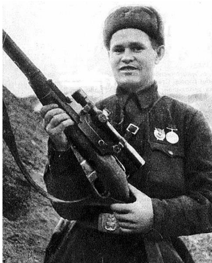
Василий Григорьевич Зайцев (1915-1991) – снайпер 62-й армии Сталинградского фронта, Герой Советского Союза

Зайцеву поручили открыть снайперскую школу, «выпускники» которой впоследствии стали называться «зайчатами». Противник нес от снайперов огромные потери. Тогда немецкое командование отправило в Сталинград лучших снайперов Германии. Многие из них участвовали в XI Олимпийских играх в Берлине в 1936 году. Был среди них и начальник снайперской школы майор Эрвин Кёниг. Его считали лучшим стрелком фашистского Рейха, но в борьбе с русским снайпером Василием Зайцевым Кёниг проиграл.