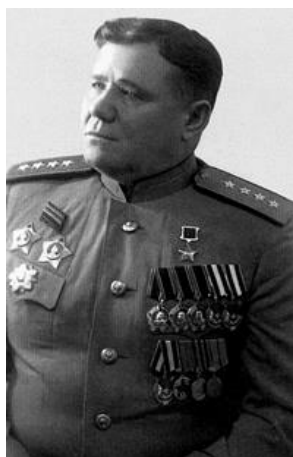
Генерал армии Андрей Иванович Ерёменко

Он вёл по Красной площади во время Парада Победы 24 июня 1945 года колонну 4-го Украинского фронта, который во время войны четыре раза поменял свое название, но начинал им командовать (когда он был Юго-Восточным фронтом) и заканчивал А. И. Ерёменко!»