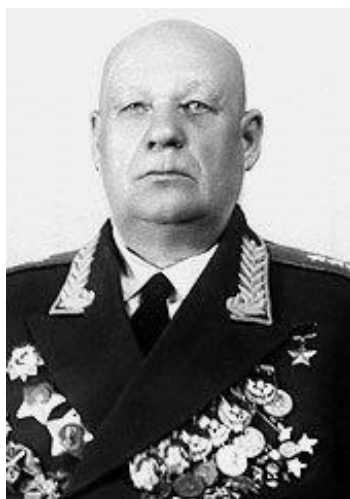
Михаил Степанович Шумилов (1895-1975) – советский военачальник