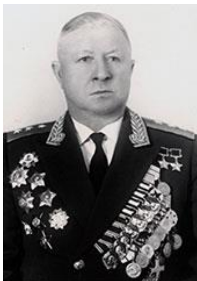
Генерал-полковник Александр Родимцев

Добровольцем Александр Родимцев отправился в Испанию, став одним из первых Героев Советского Союза. Его первая «Золотая Звезда» имеет номер 45.